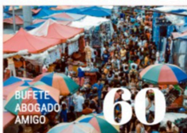
¿De particular a particular?