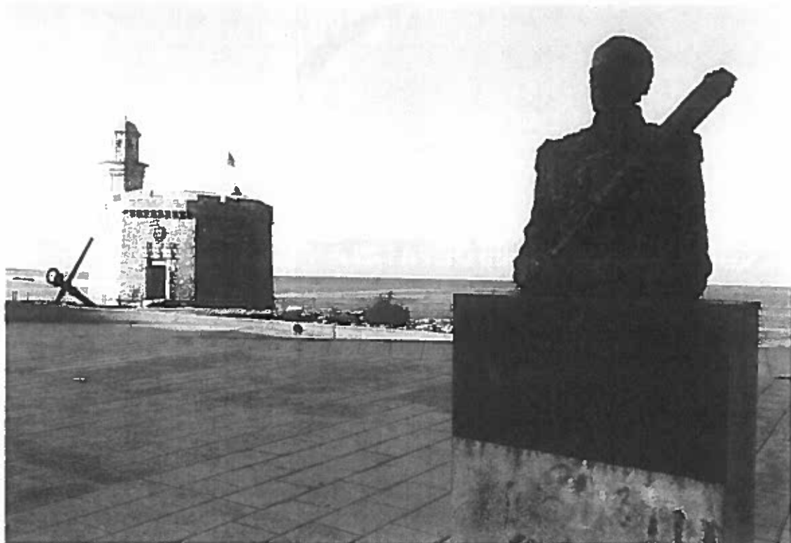
Plaça de l'almirall Farragut de Ciutadella

grogua en 1808 i amb son pare al front de guerra, el segon dels Farragut Shine va ser 'adoptat' pel comandant i amic del pare David Porter, canviant-se un moment donat el nom de James pel de David Glasgow en homenatge seu. Amb 10 anys ja estudiava a Washington i Chester i s'embarcà com a guardamarines a la fragata Essex. Dos dels capítols potser més novedosos, i curiosos, de la més coneguda vida de David G. Farragut que es relaten a la publicació sobre els Farragut i Menorca, es relacionen amb les seves dues estades a l'illa. La primera vegada que David G. Farragut va venir a Menorca va ser passant l'hivern al port de Maó amb la mítica fragata USS Constitution, on s'hi embarcà llavors com a